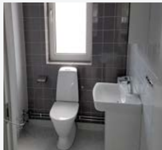
Badrum och kök i nyrenoverad lägenhet på Rocknevägen i Bredaryd.