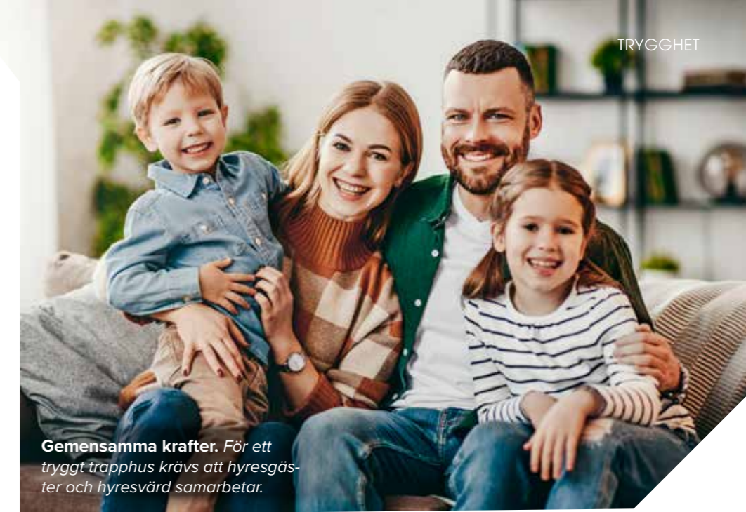
Gemensamma krafter. För ett tryggt trapphus krävs att hyresgäster och hyresvärd samarbetar.

Genom undersökningen får vi veta vad ni vill att vi ska fokusera mer på. Den ligger också till grund för kommande arbete i områdena. Därför är det viktigt att så många som möjligt gör sin röst hörd. Missa inte att skicka in dina svar före sista svarsdatum.